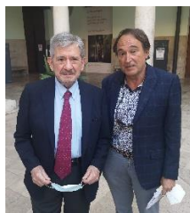
Con Enrique Baron, Ex Presidente del Parlamento Europeo y Presidente de UEF España