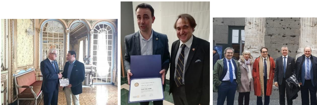
Con el subdelegado del Gobierno en Bizkaia, con el alcalde de Portugalete y con el Lehendakari y otros líderes

En ese sentido, pondré al servicio del Distrito y de Rotary toda mi experiencia internacional, con la Comunidad y el Ayuntamiento, la