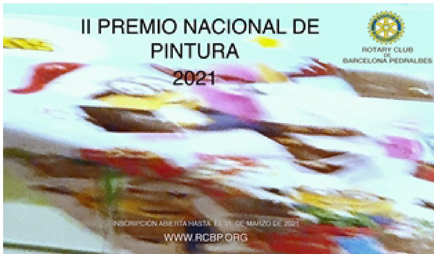
Cartel del Premio 2021