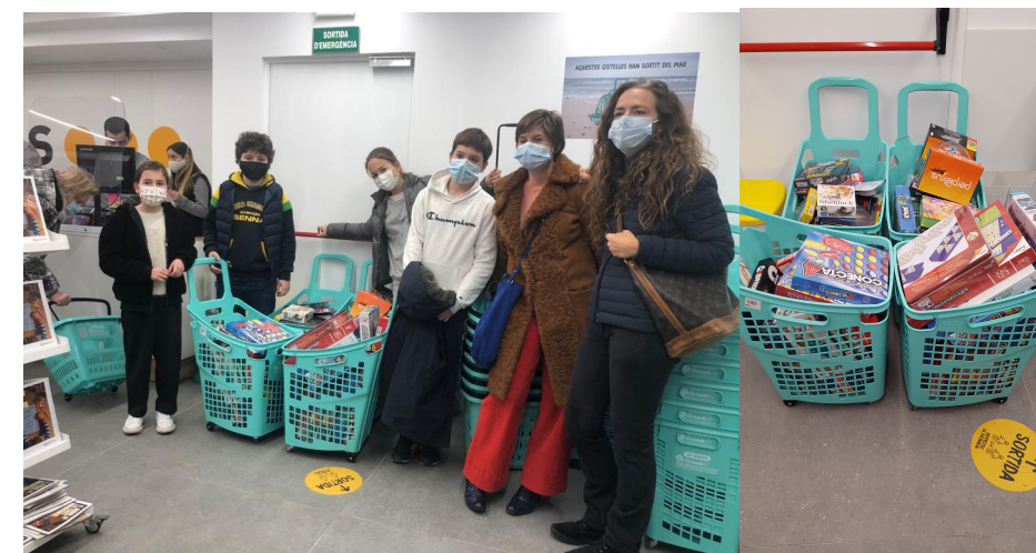
Imagen de grupo

Gràcies al vostre suport, aquest any podrem aconseguir que molts infants de l'Associació Educativa Itaca puguin gaudir d'un regal!