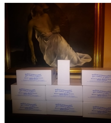
Entrega Galletas a la Parroquia de Santa Anna