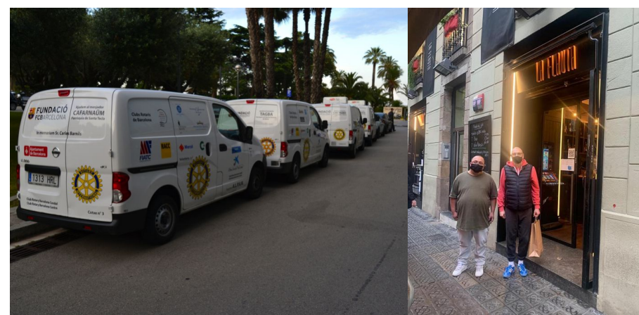
Voluntarios de La Caixa

Los 1.000 euros aportados nuevamente por nuestro club el pasado mes de diciembre al proyecto distrital ALPAN , se han convertido en 720 bocadillos adquiridos en el restaurante La Flauta , que se han entregado al comedor solidario El Caliu (en la foto, voluntarios de La Caixa en acción).