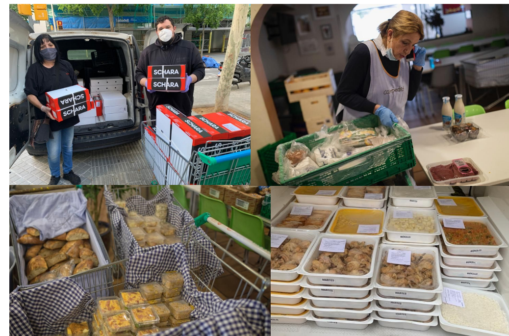
reparto y entrega de comida por parte de los voluntarios

El viernes 13 de Marzo, como cada día, los equipos de voluntarios de LaCaixa hicieron su recorrido habitual de retirar la comida de los hoteles y llevarlos a los comedores. Aunque se hablaba del virus no podíamos imaginar los acontecimientos que nos esperaban. Aquel fin de semana fue muy activo en llamadas telefónicas y desgraciadamente tres de los comedores dieron positivo en coronavirus y fueron cerrados automáticamente. También los hoteles y voluntarios estaban preocupados por la situación, por lo que tomamos la decisión de suspender el servicio. El día 17 de Marzo recibimos, de la empresa Booking , la donación de 450 comidas, que hubieran sido la comida de tres días de sus empleados, preparadas en bandejas. Con nuestras instalaciones cerradas pensamos en ayudar a la Fundación Arrels , muy agradecidos por la ayuda.