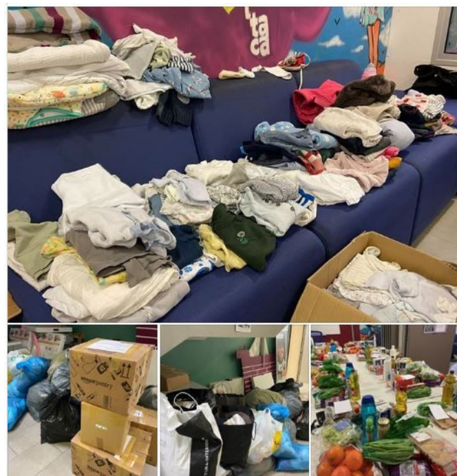
Entrega ropa y alimentos para Itaca els Vents

Associació Educativa Itaca Ayer a las 17:37 · 🌐 🙏 Gracias a nuestros amigos de Rotary Club Barcelona Pedralbes, que nos han donado cajas de ropa de bebé 🍼 y adult@ 👤 y han realizado una donación para poder seguir haciendo frente a los packs de alimentación de familias 🏠 de Collblanc La Torrassa. Esta situación de emergencia está dejando a los que estaban en situaciones precarias en situaciones aún más críticas 🚨, y a muchas familias que no requerían de soporte que ahora por primera vez, acuden a por alimentación. ¡🙏 Muchas gracias de nuevo por vuestra ayuda 🙏!