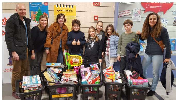
Juguetes enviados a Itaca els Vents