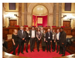
Fotografía de grupo en el Parlament