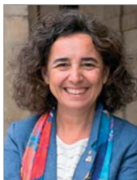
Ana Puerto Gobernadora del Distrito 2201