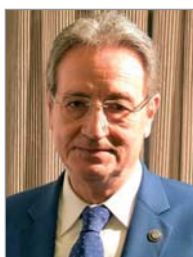
Guillem Saez Gobernador del Distrito 2202