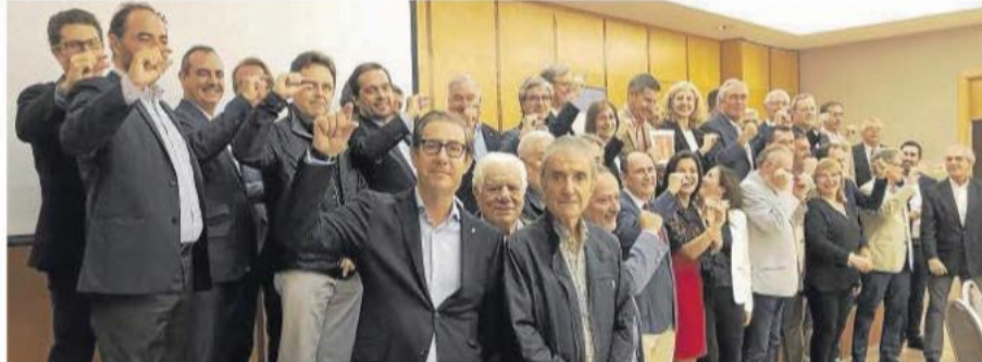
Los rotarys de TGN hacen el signo de lucha contra la polio junto a la directora general de Indústria de la Generalitat, Matilde Villarroya.

DIARI DE TARRAGONA DIMECRÉS, 24 D'OCTUBRE DE 2018