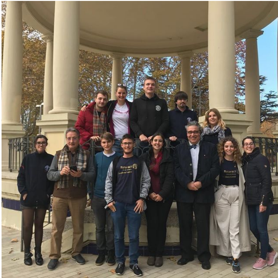
ASAMBLEA DISTRITAL DE ROTARACT EN LLEIDA SÁBADO, 25 DE NOVIEMBRE DE 2017