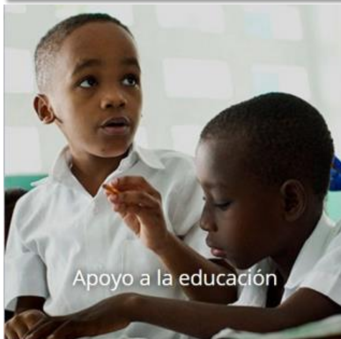
Apoyo a la educación

Mejoramos el acceso a la atención médica de calidad, el saneamiento, la educación y las oportunidades económicas para que las madres y sus hijos puedan disfrutar de una vida mejor.