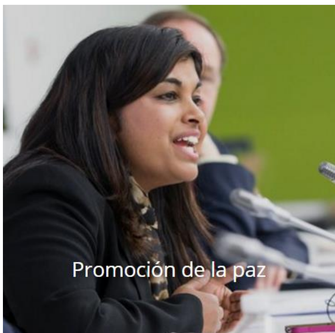
Promoción de la paz