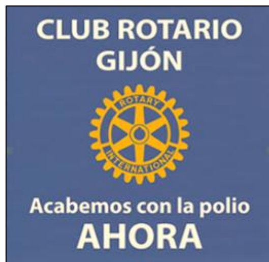
SOLO FALTA UN POQUITO PARA ACABAR CON LA POLIO. María Grazia Cucinotta. Actriz, productora, guionista y modelo. Italia