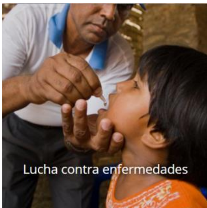
Lucha contra enfermedades

Rotary promueve la comprensión entre culturas, capacita a líderes jóvenes y adultos en la prevención y mediación de conflictos y presta apoyo a los refugiados que huyen de zonas de conflicto.