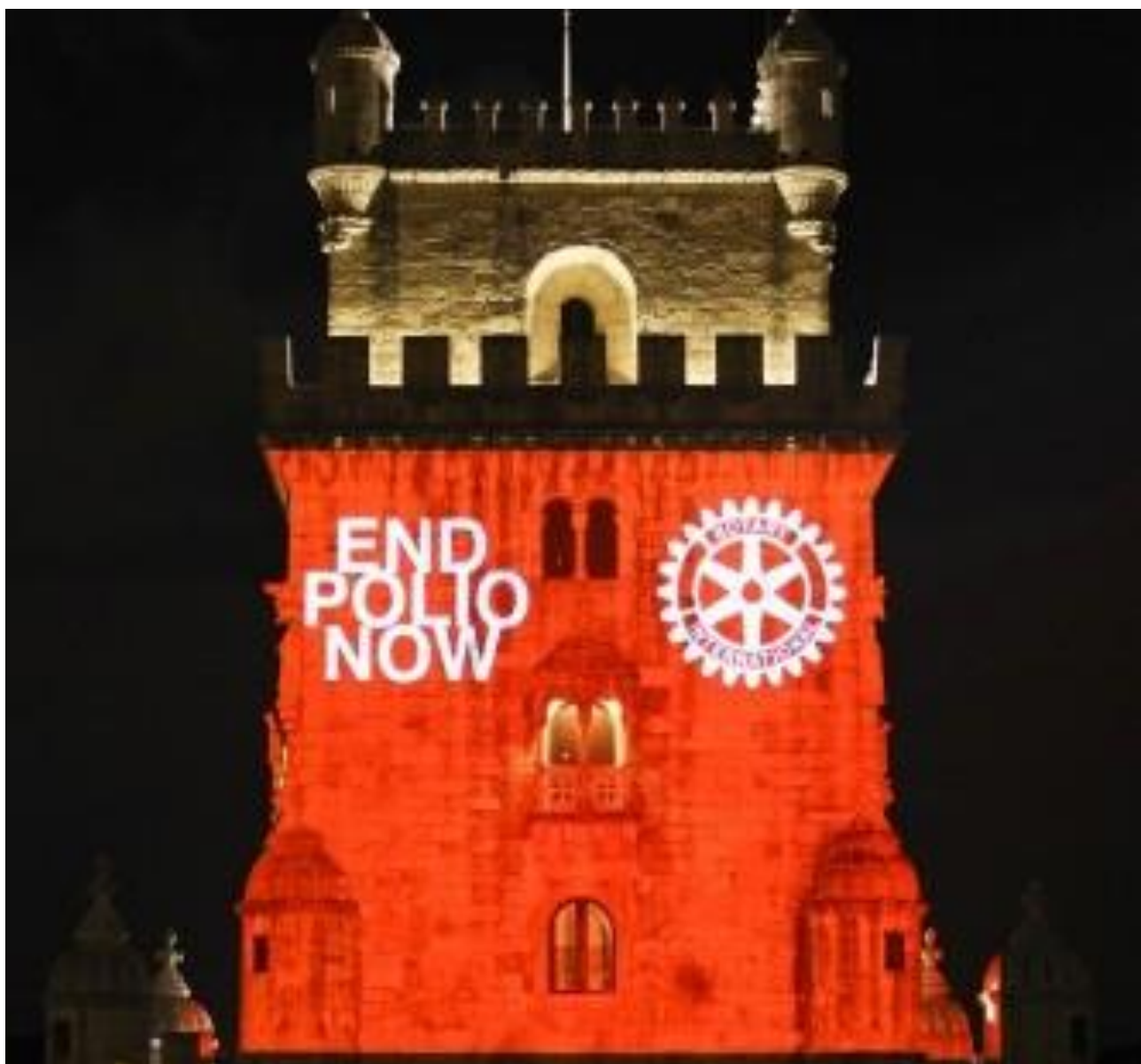
Torre de Belem, en Lisboa (Portugal) iluminada por los rotarios de Lisboa con motivo de la Convención de Rotary International celebrada en Lisboa del 23 al 26 de Junio de 2013.