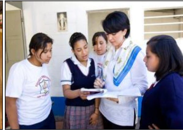
Fondo de Dotación Para un mañana seguro