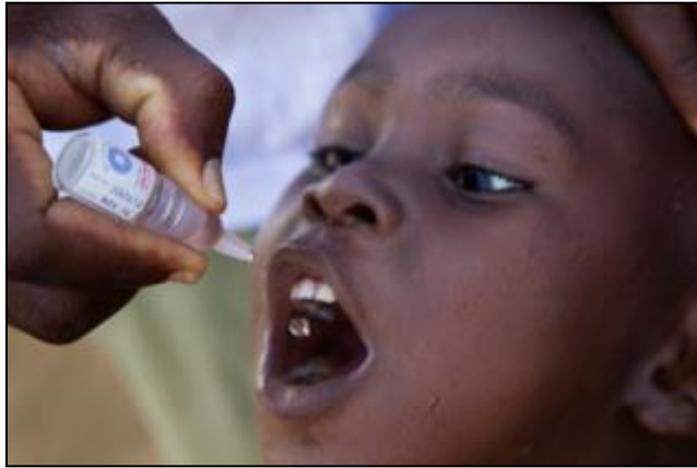
Fondo PolioPlus Pongamos fin a la polio