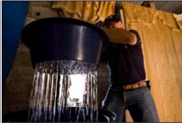
Fondo Anual Contribuyamos hoy