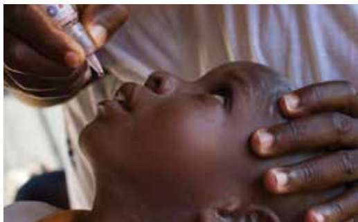
Un rotario vacuna a un niño contra la polio en Nigeria (África)

Las contribuciones de nuestros socios y de otros colaboradores de la Fundación nos ayudan a lograr un cambio sostenible en comunidades necesitadas. Para averiguar cómo ayudar a nuestra Fundación, puedes consultar al presidente del comité de La Fundación Rotaria de tu club o visitar rotary.org/donate . Si deseas más información, descarga la Guía de consulta rápida de La Fundación Rotaria o toma el curso básico sobre La Fundación Rotaria en el Centro de formación de Rotary.