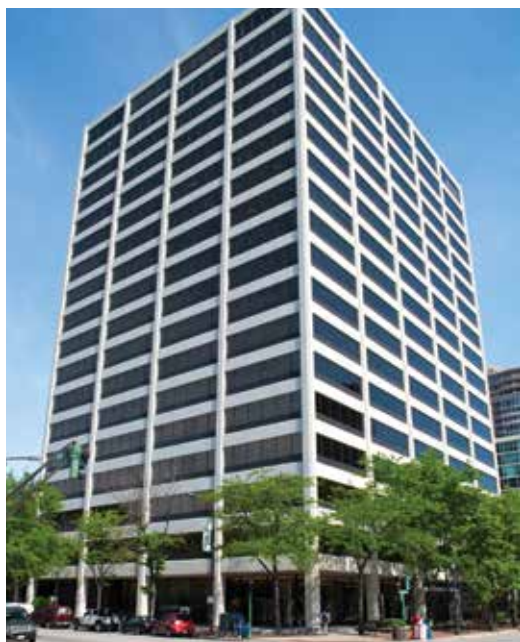
One Rotary Center en Evanston, Illinois (EE.UU.)

Rotary International está administrada por su Secretaría, que está compuesta por el secretario general y casi 800 empleados que trabajan para apoyar a clubes y distritos de todo el mundo. La sede mundial de Rotary está ubicada en Evanston, Illinois (EE.UU), en el edificio One Rotary Center el cual cuenta con un auditorio con 190 asientos, los archivos de Rotary y una